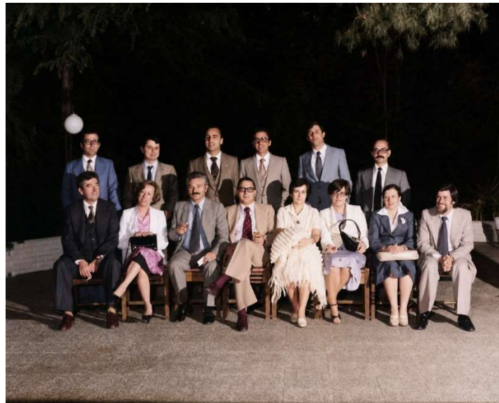
Inspectores de Educación 1980 3