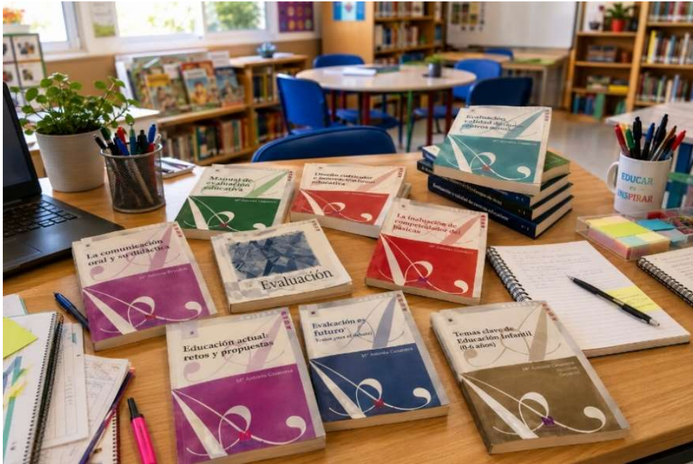
Recreación artística que presenta algunos de los libros publicados por la autora. 6

Cuesta mucho romper con las rutinas, incluso en docentes que se quejan de todo lo que tienen que corregir..., cuando tienen la solución en su mano eliminando el examen y obteniendo información fiable para evaluar mediante otras técnicas y otros instrumentos. No sé si alguna vez conseguiremos superar esta situación, a la que no le veo ninguna ventaja: en un examen no se valora todo lo aprendido por un estudiante y tampoco un número dice nada acerca de lo aprendido. Pero parecen dogmas imbatibles.