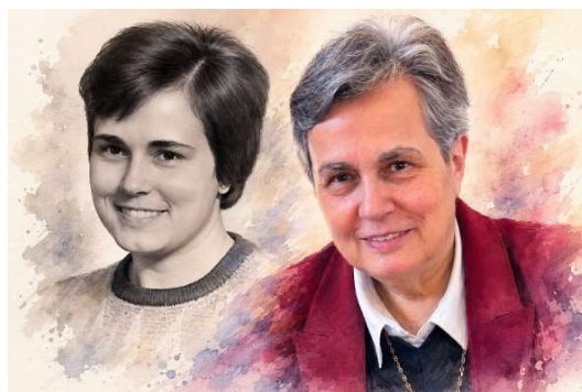
De 1975 a 2025 5

MAC: Quizá lo más difícil y, a la vez, lo más gratificante, fue el atreverse a comenzar con una experiencia que no tenía precedentes en la zona donde yo estaba, en Vic (Barcelona). Y creo que tampoco en otras, porque nos iban a ver desde otros puntos de España para comprobar cómo estaba funcionando.