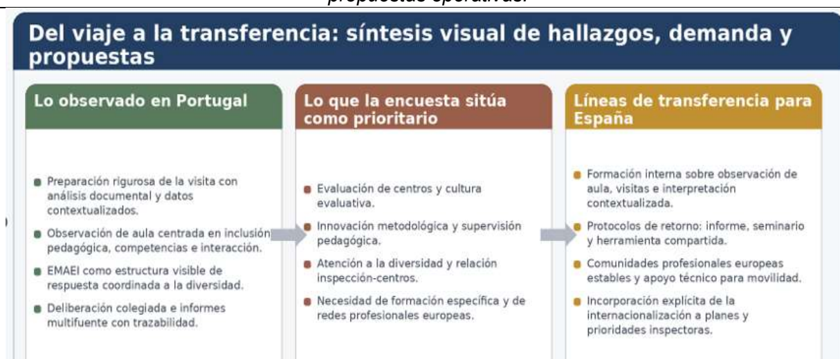
Figura 3. Del viaje a la transferencia: relación entre observación, demanda profesional y propuestas operativas.

Esa convergencia resulta especialmente útil porque enlaza lo observado en Portugal con las propuestas que aparecen de forma reiterada en los documentos de base: convertir la experiencia internacional en formación interna, herramientas compartidas, apoyo organizativo y planificación evaluable. La lógica de conexión entre observación, demanda y propuestas se resume en la figura 3.