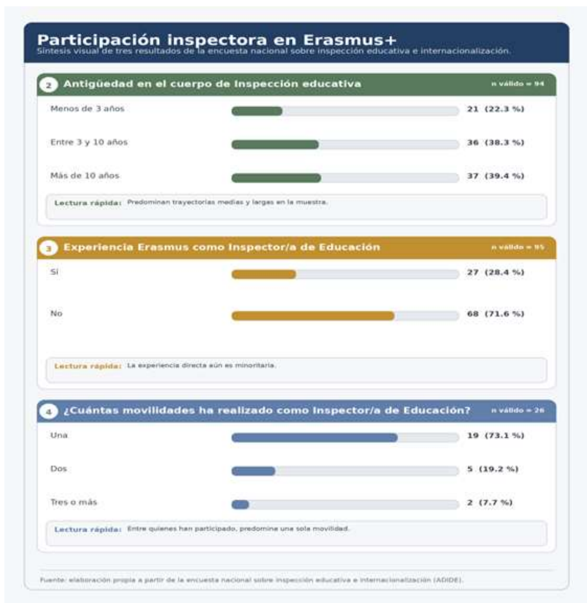
Figura 2. Participación inspectora en Erasmus+