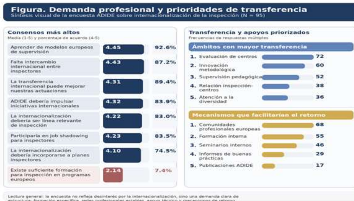
Figura 4. Demanda profesional y prioridades de transferencia detectadas en la encuesta ADIDE