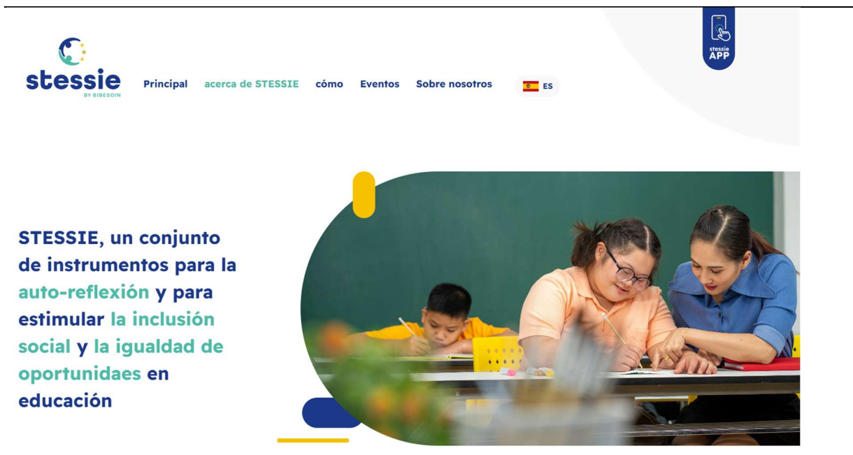
Figura 1. Portada de la página web Stessie.

que refuerza el carácter colaborativo e internacional del proyecto.