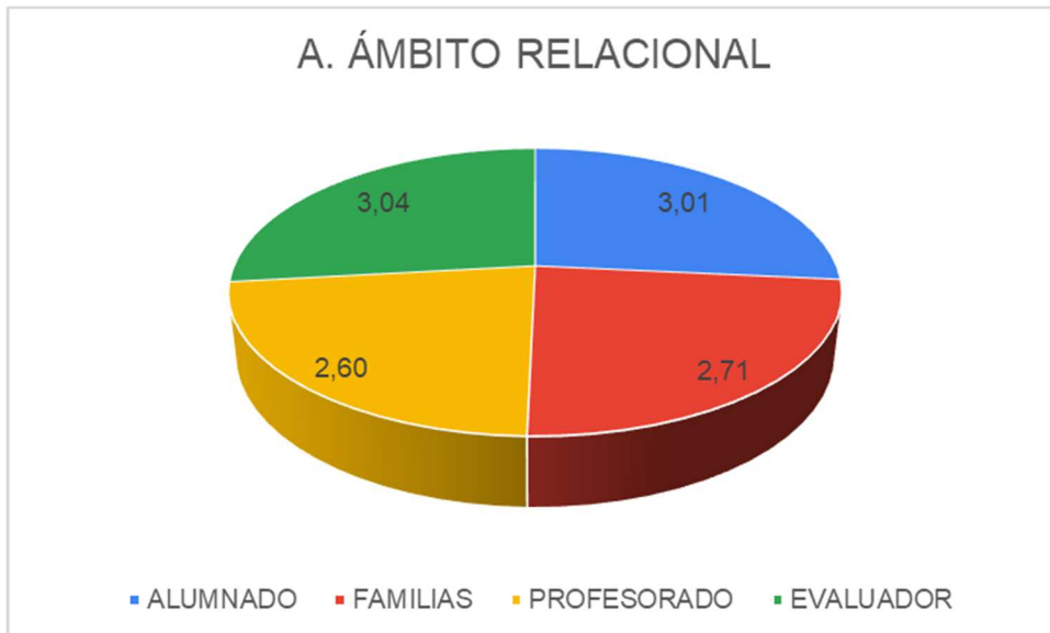
Figura 6: Ejemplos de gráficos del ámbito relacional.

Igualmente, se representó gráficamente la valoración de cada ámbito, dimensión y subdimensión.